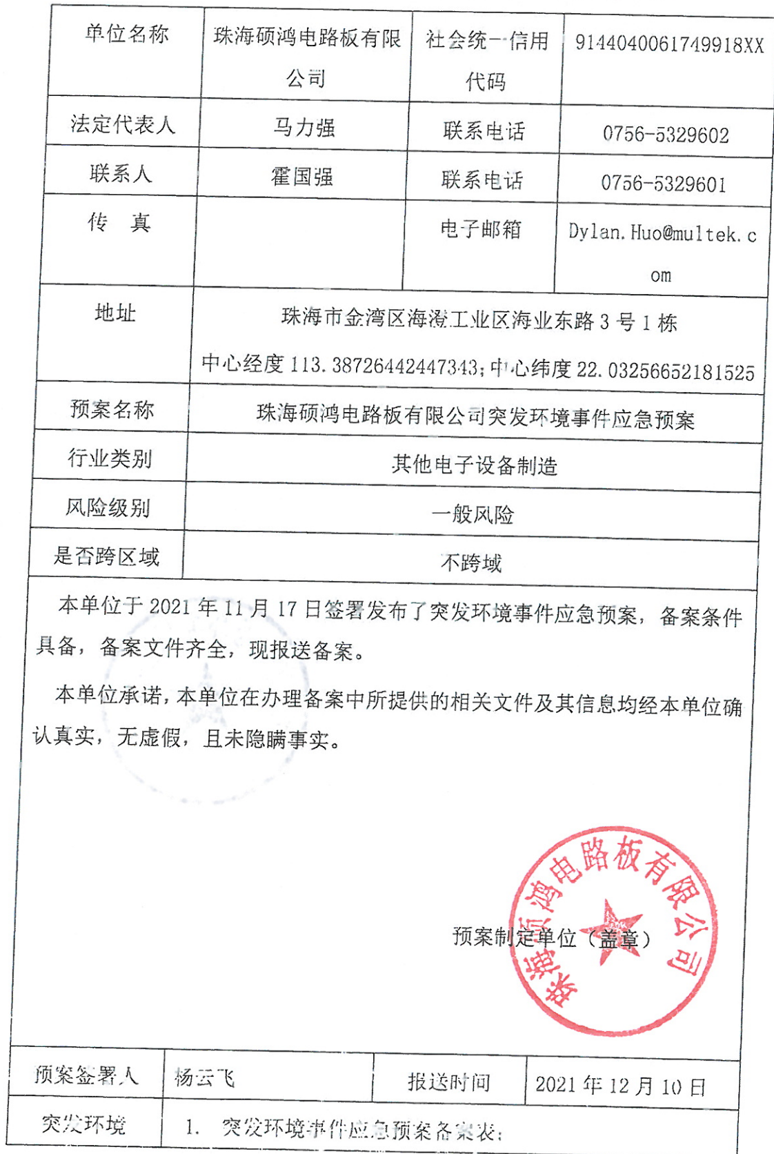
企业事业单位突发环境事件应急预案备案表